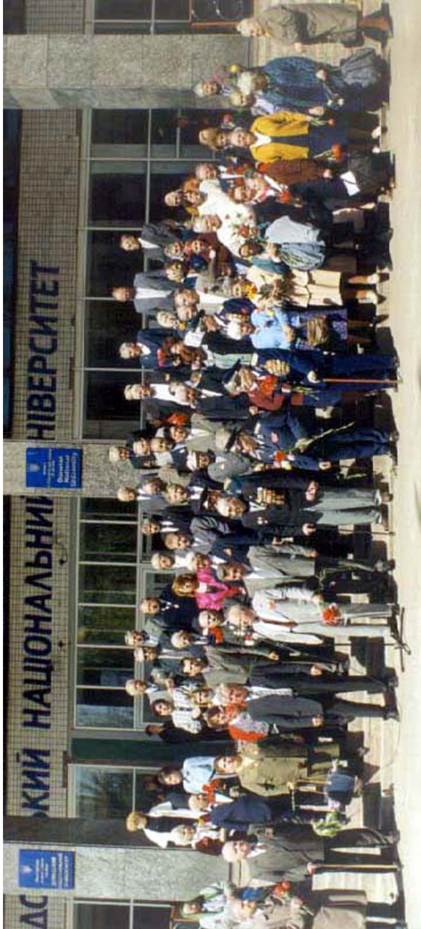
Чествование ветеранов Донецкого национального университета